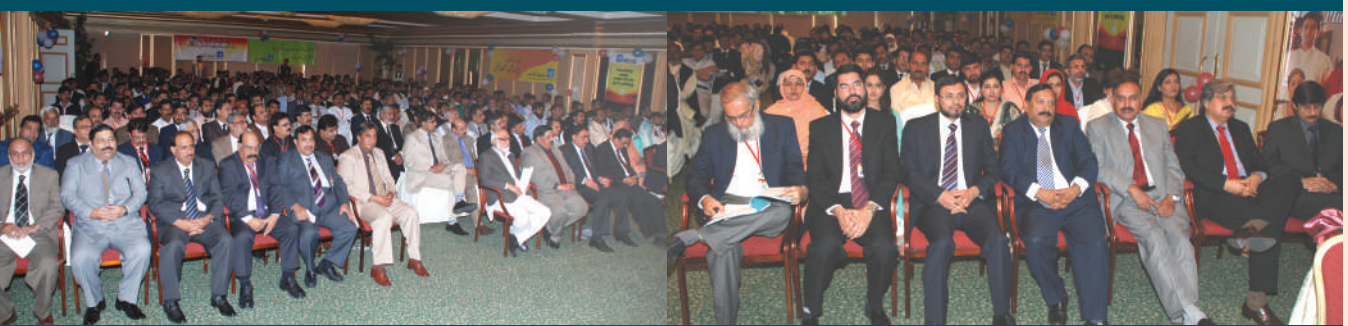
مندوبین کنونینشن کی ایک جھلک

پینشن کی کارکردگی کا ذکر کرتے ہوئے کہا کہ رواں سال کی پہلی سہ ماہی میں 96 کروڑ 41 لاکھ روپے سے زائد کا نیا پرمیئم حاصل ہوا جبکہ 2010 میں 1294 گروپس سے 3 ارب 95 کروڑ روپے سے زائد کا پرمیئم حاصل کیا۔ انہوں نے انفرادی بیمہ زندگی کے تحت