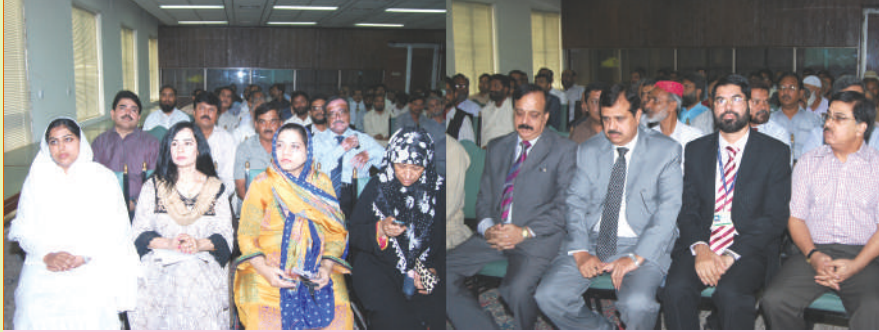
حاضرین تقریب کی ایک جھلک