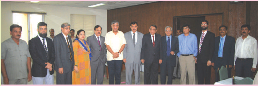
تقریب میں متعلقہ ڈویژن/ڈپارٹمنٹ کے افسران کا چیئرمین اور ایگزیکٹو ڈائریکٹرز کے ہمراہ گروپ فوٹو

اگر ہم اپنائیت، نفسیات اور انتظام کے اصول کی اہمیت کو سمجھ لیں تو پھر ہمارے بڑے بڑے مسائل حل ہو جائیں گے، ایگزیکٹو ڈائریکٹرز کا اظہار خیال