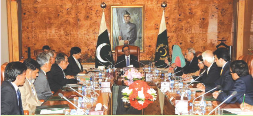
صدر مملکت جناب آصف علی زرداری ایوان صدر اسلام آباد میں لائف اینڈ ہیلتھ انشورنس کے اجلاس کی صدارت کر رہے ہیں، چیئر مین اسٹیٹ لائف بھی اس موقع پر موجود ہیں

ایوان صدر میں چیئر مین جناب شاہد عزیز صدیقی کی اسٹیٹ لائف کی کارکردگی پر بریفنگ