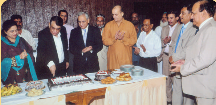
پرنسپل آفس میں منعقدہ تقریب میں جنرل نیجری کی ترقی پر اظہار مسرت کا انداز