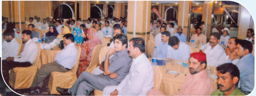
ٹاپ سیکلر میٹنگ کنوینشن کے شرکاء