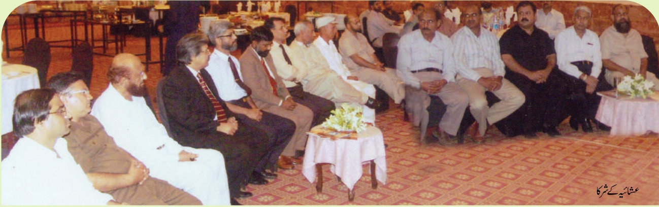
عشاء کے شرکاء